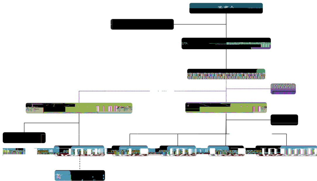
图 : 密 任 产

i 中 j 任 产 作 , rs 与 Tt u 体制 、 与 , vw xy 作 z 与 { | } , ~f 事会 • €。 公 b c • , f „ ) 力 D... O , 与 „ ) r 协 l b 任 t , ‡ ^ 供 别与 。